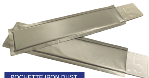
POCHETTE IRON DUST