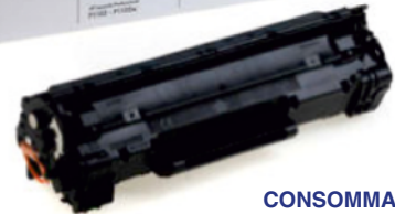
CONSOMMABLE IMPRIMANTE LASER